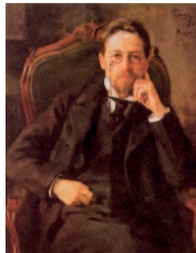
Anton Pavlovič Čechov (qui ritratto da Osip Braz nel 1898) fu medico ed autore di racconti e di teatro. Sulle sue orme, Luigi Rainero Fassati potrebbe, a buon titolo, definire la medicina come sua sposa e la letteratura come la sua amante.

L'occhio e l'ascolto di Landi/Fassati si configurano come ambiti prioritari su cui concentrare le risorse del prendersi cura dell'altro, di una condivisione di vissuti, di parole e silenzi, di gesti e di inerzie, di desideri e rinunce. Disegnano un luogo elettivo di "compassione". È la capacità di patire-con, di condividere, di attitudine esemplarmente interpretata anche dal Nobel Kenzaburo Oe, là dove scrive: «Io interpreto il termine compassione come la capacità spontanea ed insieme voluta di cogliere quanto alberga nell'animo della per-